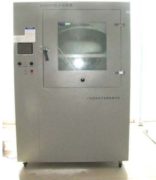
图 1 防尘箱