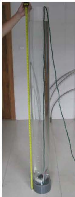
图 2 潜水试验容器