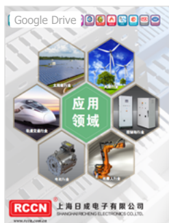
Hot Sale Catalogue